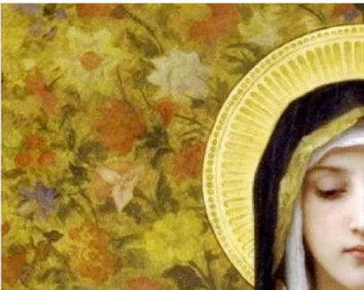
Ausschnitt: W.A. Bouguereau, Madonna of the Lilies, 1899